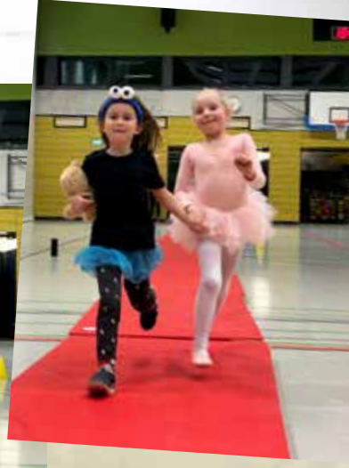
Fasching in der KiLa