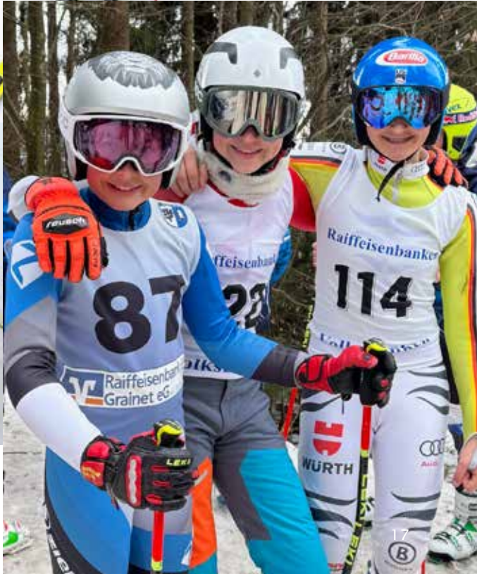
Die Markgrafs fahren eine erfolgreiche Saison - Bericht nächste Seite