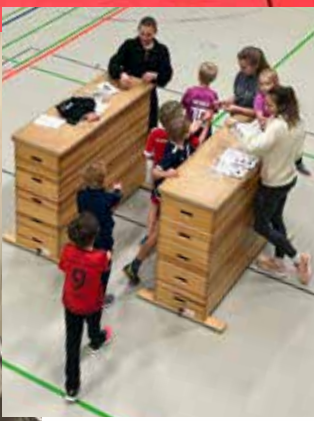
Spendenübergabe im AMG Impressionen vom Spendenparcours