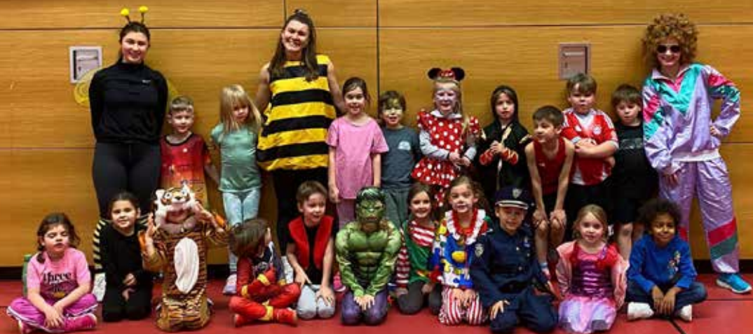
Fasching in der KiLa