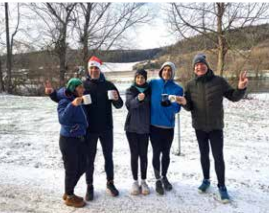
Der Lauftreff Run Loose aus Kallmünz hat zum Jahresabschluss einen gemeinsamen lockeren Lauf über 10 km im Naabtal absolviert.