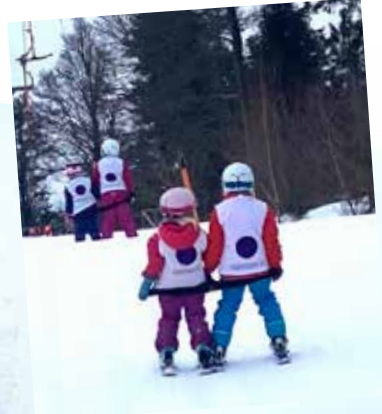
Impressionen vom Ski- und Snowboardkurs am Geißkopf vom 24./25. Januar und 7./8. Februar 2026