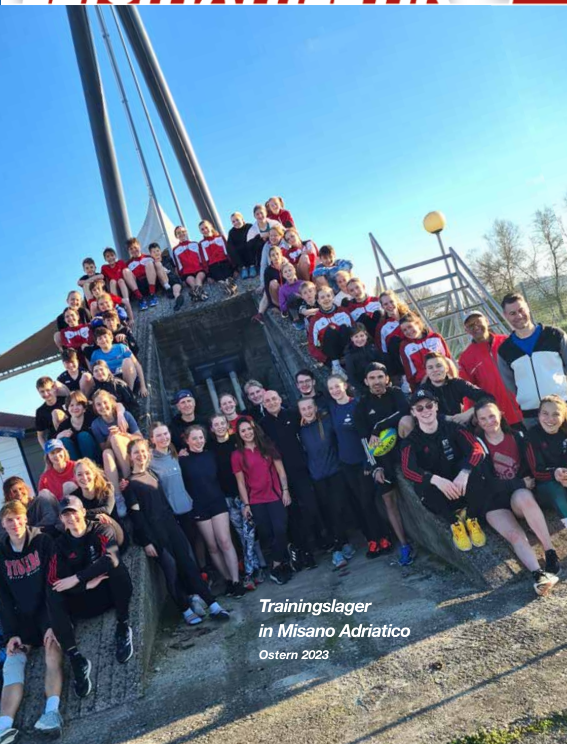
Trainingslager in Misano Adriatico Ostern 2023