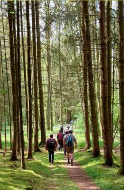
Oben und Mitte: 19. März 2023 Rundwanderung zum Schloss Kürn