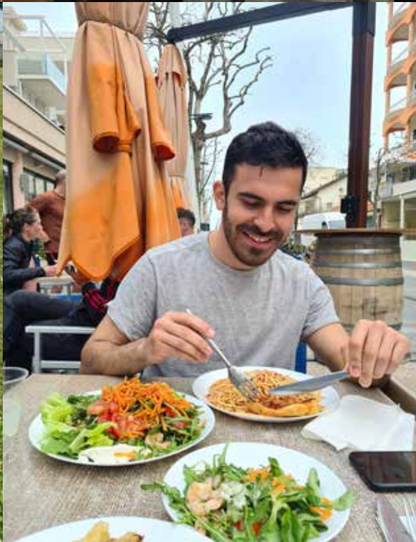
Trainings- lager in Misano Adriatico Ostern 2023